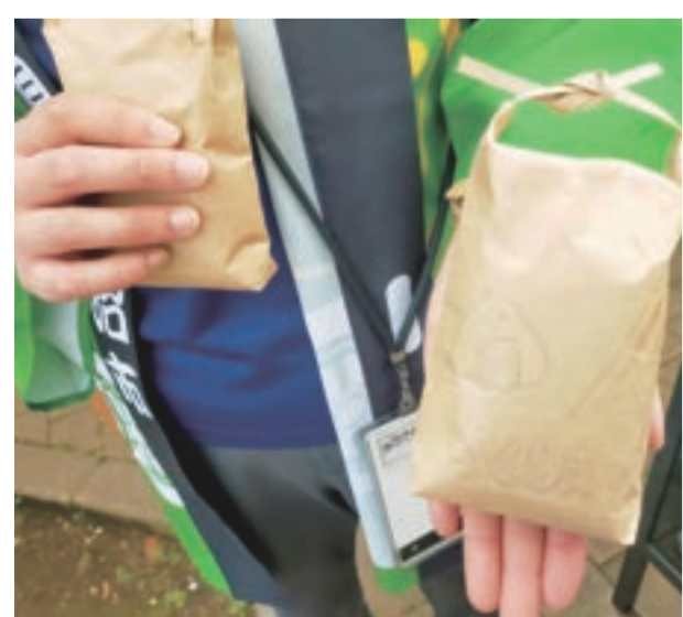
オリジナル米袋が作れる魚沼市観光協会ブース